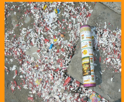
Les pétards dans les rues de Pondichery après Dipavali....