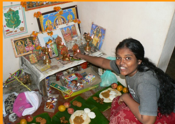
Préparation de l'autel familial pour la puja (prière) de Dipavali .