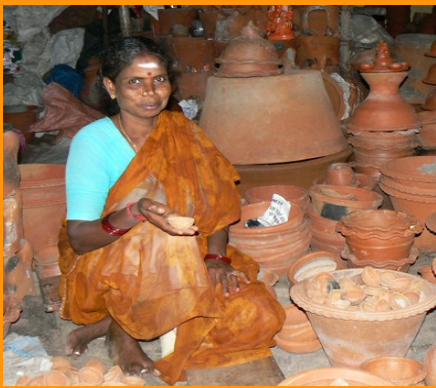
Marchande de lampes à huile

Chaque année dans la nuit la plus sombre de la quatorzième phase de la lune " Tchatourdashi" du mois d'Ashivina "Pourattâshi" comme une ritualisation de la quête de la lumière intérieure .Cette nuit-la , tous les abords des maisons de riches ou de pauvres sont illuminés de petites lampes à huile "diouro" afin de célébrer la victoire de la lumière sur les ténèbres , c'est- à- dire du bien sur le mal .